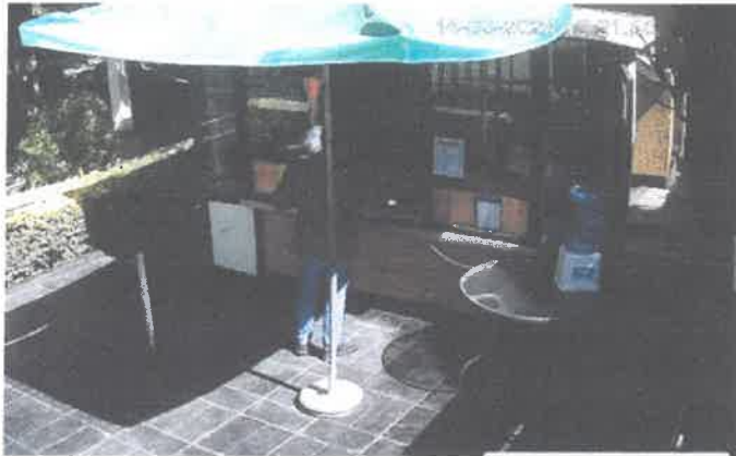
* La fecha y hora se ve en la parte superior derecha de la imagen

Este hecho inhabilita la participación de esta empresa en la presente convocatoria, debido a que la recepción de propuestas estaba establecida hasta hrs.10:00 a.m. del día 14 de marzo de 2024, según lo establecían la convocatoria en el periódico LA RAZON y en el Pliego de Condiciones.